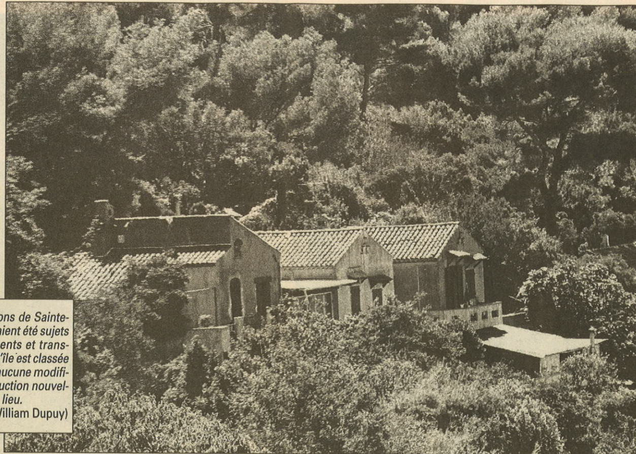
Certains cabanons de Sainte-Marguerite auraient été sujets à agrandissements et transformations. Or l'île est classée depuis 1930 et aucune modification ni construction nouvelle ne peut avoir lieu.

Transformations irrégulières, dessous de table (?) entre locataires, l'Association de défense du patrimoine historique du site des îles de Lérins devrait porter plainte prochainement